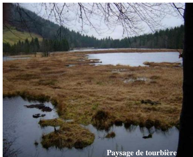
Paysage de tourbière

Notre « mille-feuilles » comporte des couches de tourbe de diverses épaisseurs (de quelques dizaines de centimètres à quelques mètres).