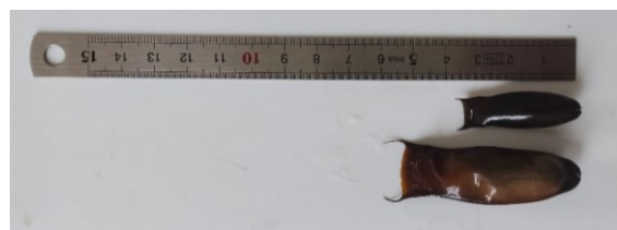
Requin chat d'Atlantique (en haut) et Requin chien espagnol (en bas)

Certaines de ces données, comme les capsules de Requin chat d'Atlantique, de Petit pocheteau gris et de Raie chardon, sont des raretés, voire les seules données nationales actuellement.