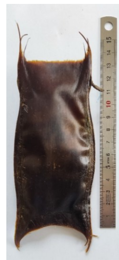
Petit pocheteau gris