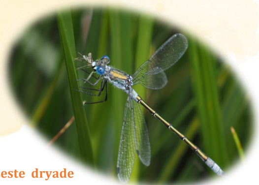
Lestes dryade — Leste dryade

Grâce à l'appui de nos partenaires, les animations de ce programme sont gratuites.